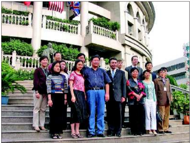
三箭集团大厦前和棋王棋后的合影。