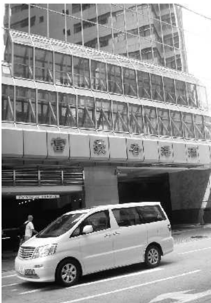
28日下午,国美控制权之争将在富豪香港酒店一决胜负。

虽然左右国美电器命运的股东大会将在距离自己1公里之外举行,但铜锣湾时代广场国美电器的销售人员小谢并不在意,“哪个大老板能赢无所谓了,我只想国美给我一份工钱养家,我们香港员工觉得这就是一场商业竞争,没有那么别的东西在里面。”