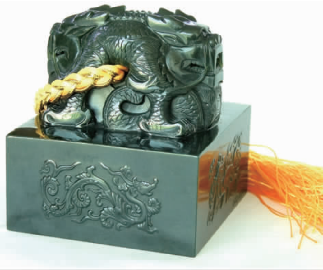
宝玺通高 8.6 厘米,玺钮高 5.6 厘米,代表 56 个民族大团圆;龙纽是威猛霸气的盘龙,龙腹穿孔附系黄色绶带,底部正方形印面边长为 8 厘米,象征中国的四面八方。四面刻有龙、凤、龟、麒麟四吉祥物,象征龙凤呈祥、健康长寿。印面凸雕篆刻世博会徽,图案形似字“世”,与“2010”巧妙组合,相得益彰。宝玺大气天成,巧夺天工,光耀王者风范!

全球限量 2010 尊,国家珠宝玉石质量检测中心逐一鉴定,确保每套均为真正和田玉! 物以稀为贵,为彰显“世博宝玺”无与伦比的至尊地位和极大的升值空间,全球只发行 2010 尊,仅供少数幸运藏家荣耀典藏。每尊都雕刻唯一限量编号,以后永不复制。每套均由上海世博局授权方可制造,并配有人民币防伪高科技专造的世博特许标签和国家出具的玉石《鉴定证书》,鉴定结论尊尊均为和田玉。