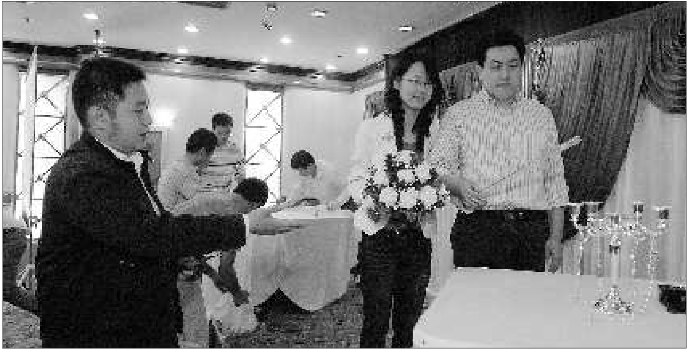
10月9日晚,济南良友富临大酒店,一对准备在10月10日举办婚礼的新人正在司仪的指导下“走台”。

据省商务厅有关人士介绍,购买下乡电动自行车单价在2000元以下的,按销售价格的13%给予补贴;单价在2000元(含)至3800元之间的,给予260元定额补贴。电动自行车下乡补贴实行“销售网点代办申领并垫付”的兑付方式,补贴资金从中央财政和省级财政(不含青岛)共同负担的家电下乡补贴资金中列支。