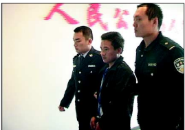
烟台警方将嫌疑人带回审讯

本报10月9日讯(记者 赵鑫 通讯员 鞠筱瑜 韩延吉)“十一”期间,一内蒙古籍男子在大连发往烟台的客滚船上冒用他人身份证时,引起值班乘警的怀疑。经盘问,民警将这名在逃7年多的嫌犯抓获归案,并于近日移交大连警方。