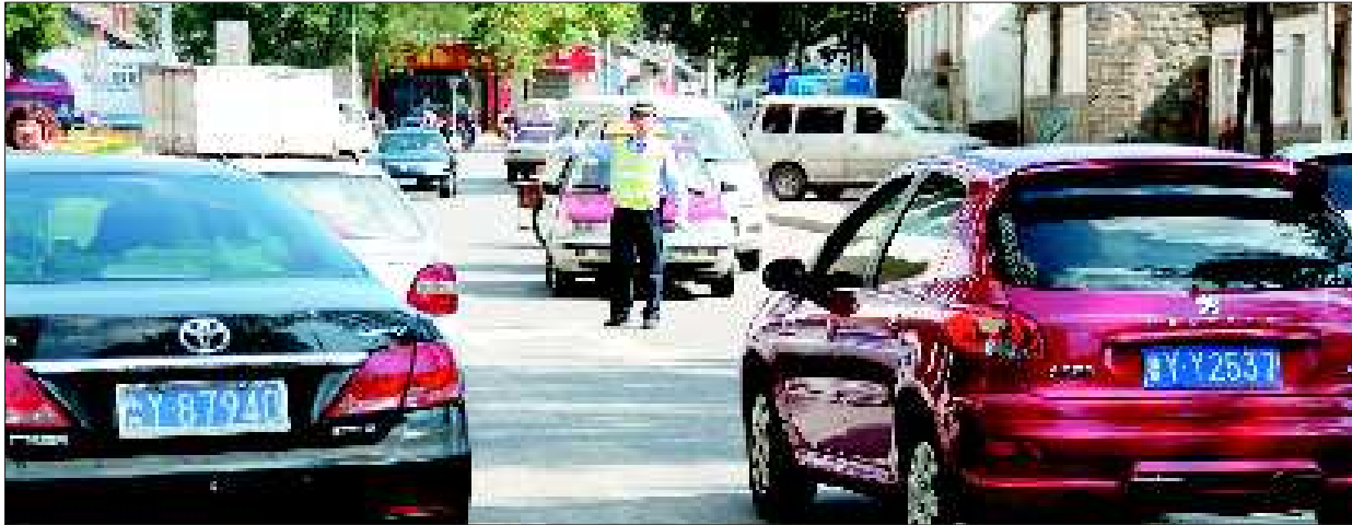
交警正在查处逆行车辆

本报10月9日讯(记者 钟建军 实习生 侯晓)紧挨着烟台市文化宫广场南侧的西关南街是一条单行道,在这条单行道上,车辆逆行屡禁不止。9日上午,记者在现场发现,交警在短短的10分钟之内便查了9辆违法行驶的车辆,其间还不乏有“逃