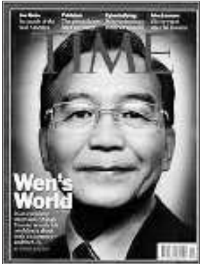
2010年10月18日封面人物温家宝。