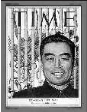
1954年3月10日封面人物周恩来。标题:红色中国的周恩来。