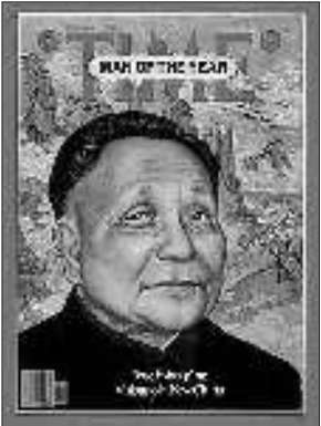
1979年1月1日封面人物邓小平。标题:邓小平,中国新时代的形象。