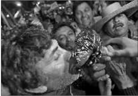
智利民众畅饮庆贺矿工得救。