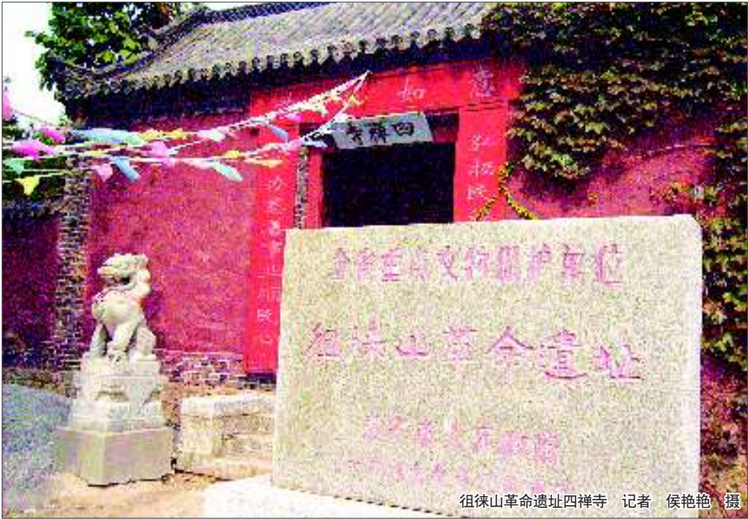
徂徕山革命遗址四禅寺