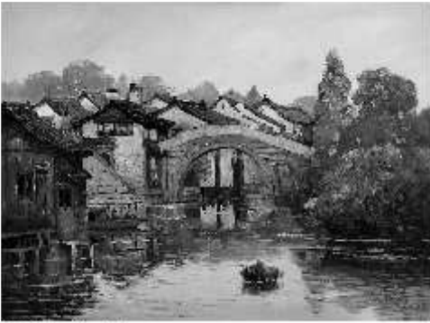
谭全昌作品 苏州小景