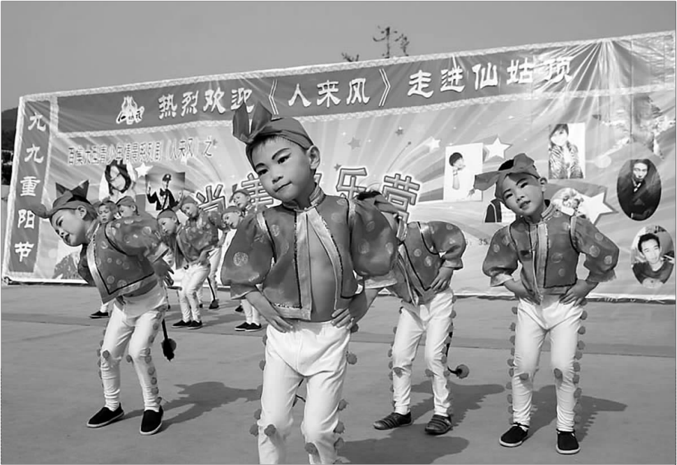
16日,望岛幼儿园的小朋友在《人来风》节目录制现场表演。16日至17日,山东电视台少儿频道《人来风》尚美时空栏目组在仙姑顶景区录制节目,来自多个幼儿园的孩子参加了现场节目的彩排、录制。

每天的一早一晚注意添衣保暖,预防感冒。未来数日,天凉风大,爱美的人士不愿意把自己裹得跟棉球似的,若如此,您可以穿件防水外套,既有温度又有风度。 前天是传统的重阳节,所谓“重阳”即阳数极盛之日,阳气此后便由盛于外而转向内收敛,此时的饮食忌辛辣,宜酸润。“少辛增酸”是为了使人体顺应自然界敛肃之气,平肺气,避免肝气郁结受病。此时的饮食还宜温,忌寒凉生冷,不要食用过多的瓜果,可常吃豆、核桃、花生、奶、蜂蜜等具有滋润效果的食品。