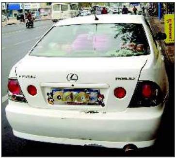
5个光盘将号牌挡了个严严实实

车,车牌号中的“7”比其他的号码颜色更深。民警心中生疑,忙将车辆拦下进行检查。没想到,在民警查看该车号牌时,发现该车前后号牌上的“7”上竟然有胶条,能撕下来,胶条把后面的“5”挡了个严严实实。驾驶员承认,自己刚从青岛回来,路上怕因超速而对车牌进行了处理。 最终,两位驾驶员因实施故意遮挡号牌行为分别被处以罚款200元,扣6分的严厉处罚。