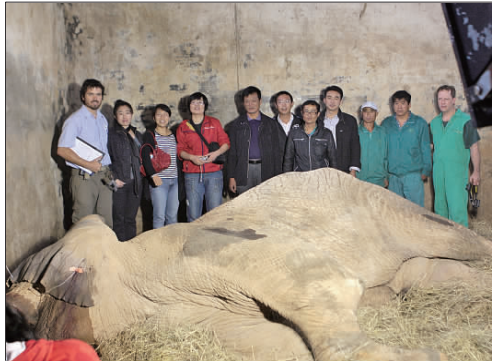
▲手术成功后皮皮苏醒前,工作人员留念。