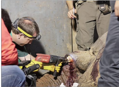
▲手术中皮皮流了不少血。