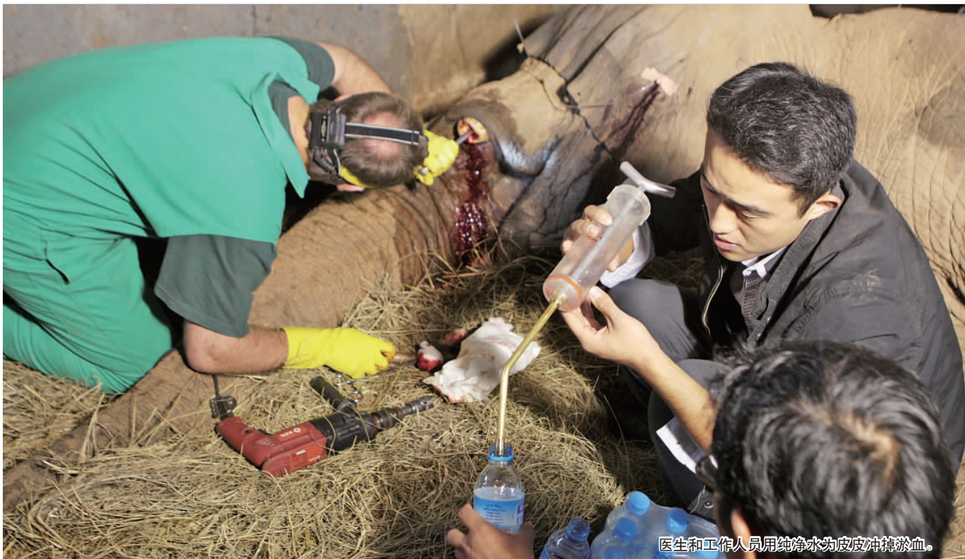
医生和工作人员用纯净水为皮皮冲掉淤血。

2006年到2010年,四年的时间,西霞口动物园的非洲象皮皮饱受牙痛之苦;2010年10月19日上午9时到12时,三个小时的手术,皮皮不仅治好了牙痛,还保住了原计划拔掉的牙齿。19日上午,西霞口动物园与请来的南非牙医联合,为非洲象皮皮进行了一场“国际救援手术”。