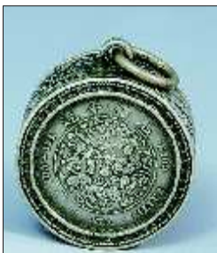
▲民国嵌银元龙纹银盒

现在尽管银器、银饰品遍地都是,但真正精美的老银器数量并不多。做工精美的老银器是很抢手的,老银器做工考究,大都是纯手工制作,所以相同的老银器也很少。