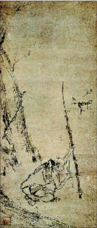
▲宋 梁楷《六祖斫竹图》

这也是上博继“晋唐宋元书画国宝展”,2005年“书画经典——故宫、上博中国古代书画藏品展”,2006年“中日书法珍品展”之后,又一次中国古代艺术珍品的大荟萃。