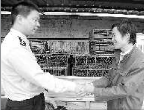
受害人领取被盗物品后对民警表示感谢。