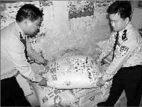
民警清点被盗赃物。