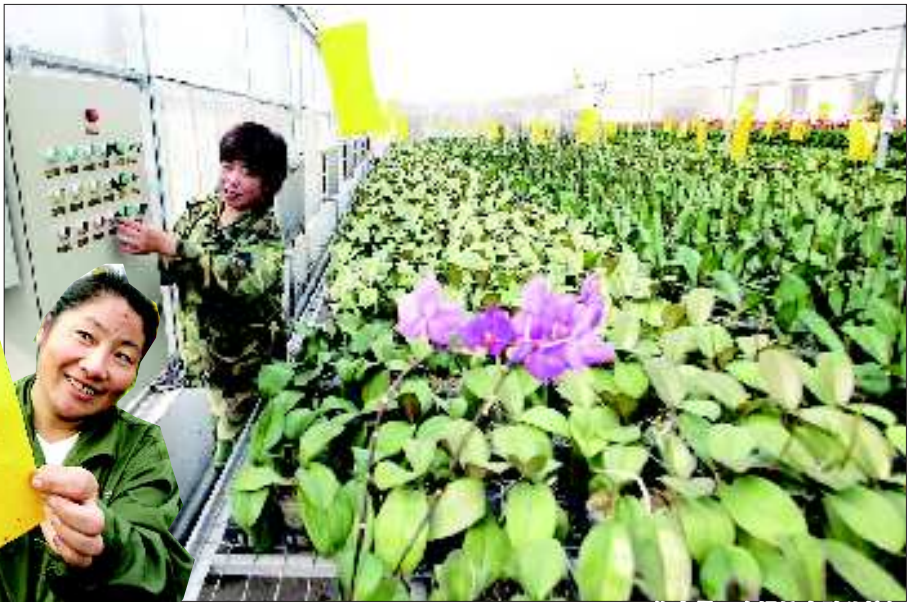
▲工作人员正在操控自动化按钮 ◀环保效果显著的节能诱虫板