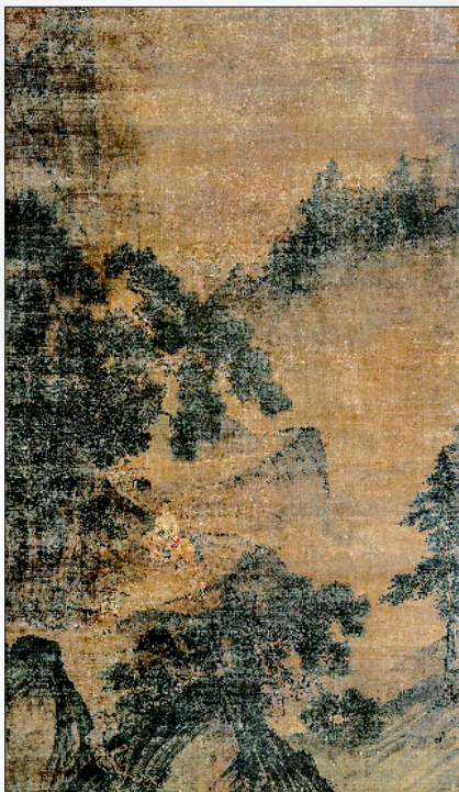
▲周臣《深山行旅访客图》