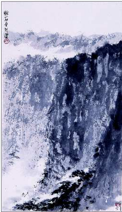
▲傅抱石《深山访友图》