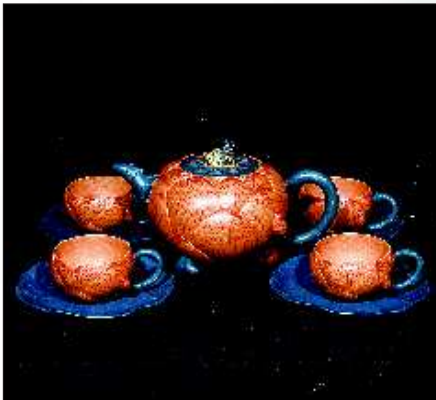
▲蒋蓉 荷花紫砂壶一套