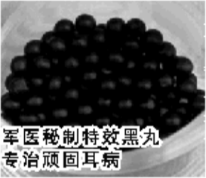
军医秘制特效黑丸 专治顽固耳病

我国著名中医学者、我国某军医大学博士生导师杨松林研究了一辈子耳病，终于在他晚年时研制出一种专治耳病的特效小丸，此小丸堪称具有让病耳“起死回生”之效，曾创“几服药让数万十几年甚至几十年的患者康复”的奇迹，很多企业家、政府要员为治耳病，不远千里，登门求医。