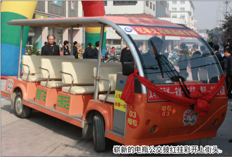
崭新的电瓶公交披红挂彩开上街头。

张伟民说，大型近郊住宅小区与公交交通间的“最后两公里”，实属小公共交通系统范畴，电瓶公交车能解决这一问题。今后，青州市将在背街小巷开通更多的“公交电瓶专线”，解决市民出行难的问题。