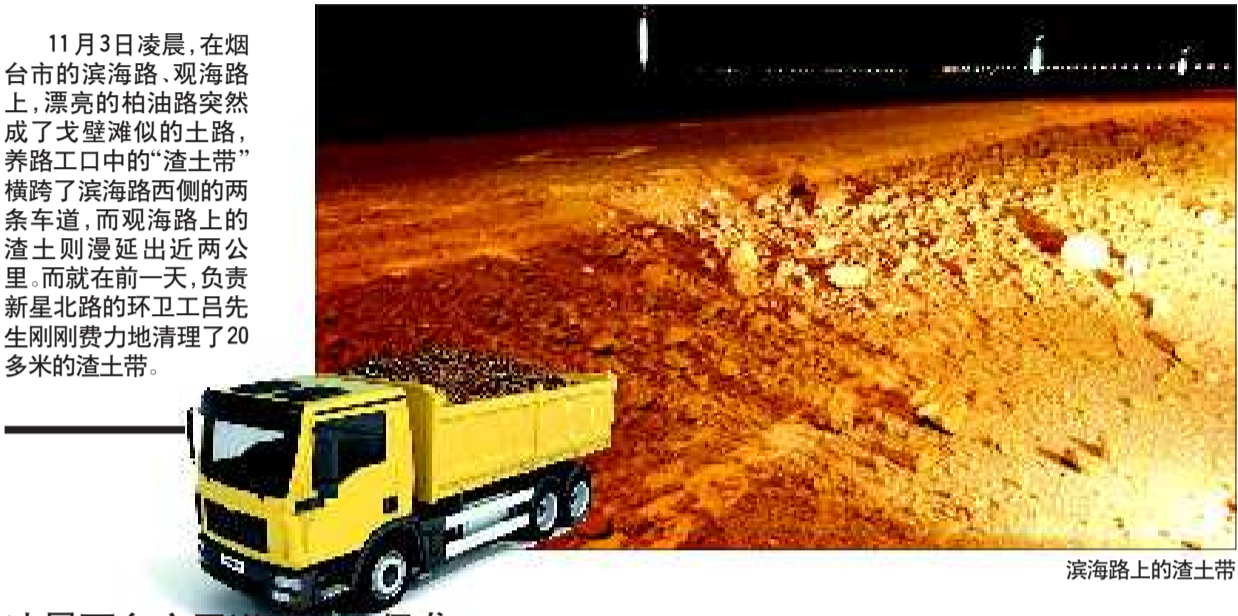
滨海路上的渣土带