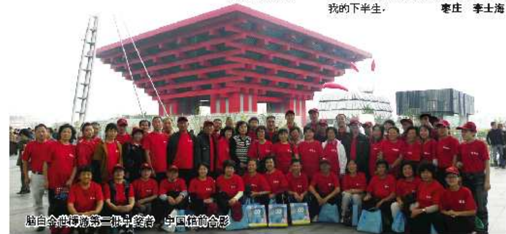
脑白金世博第三批中奖者 中国信前合影