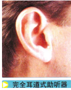
完全耳道式助听器

●来自听力王国丹麦百48号(泉城广场大屏幕)年品牌,专业助听器制造商。新推出“臻韵”系列全数码助听器,声音更自然清晰,具有防汗水功能。免费提供检测、试听、试戴 ●特大功率全数码助听器,可让聋儿重返有声世界。 专卖店地址:济南市泺文路