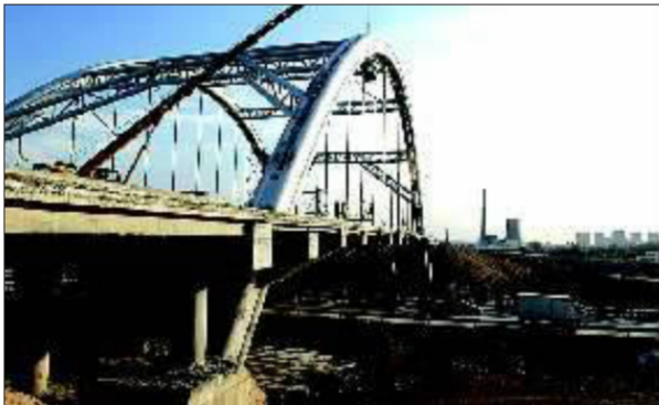
横跨烟威高速的大桥。