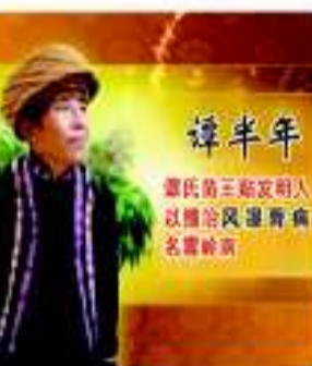
谭三 谭氏苗王贴发明人 九代祖传 祛风湿骨痛 名震神州