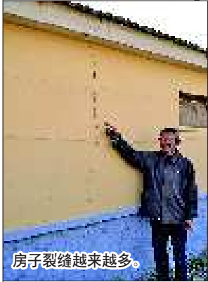
房子裂缝越来越多。