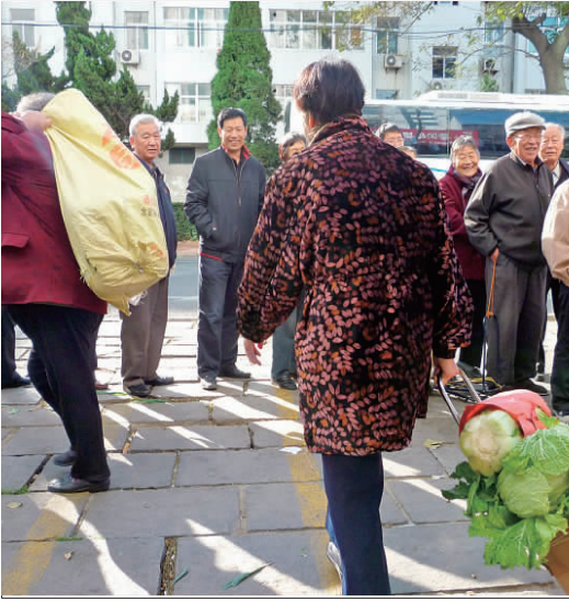
买到了特价白菜回家去。

本报威海11月14日讯(记者 吕修全) 14日早8点,花园南路的利百佳超市门前,30多位顾客排起了长龙,大家在等待超市9点开卖的特价大白菜,排在队伍最前面的孙德香女士坐在自带的小马扎上,“我7点多就来这儿等了,就是为了买几棵便宜白菜。”上午10点多,孙德香买了3棵白菜,省了3元钱。