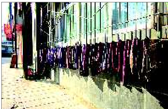
理发店的毛巾直接晾在了防盗网上。

15日,在洪楼西路及周边,记者走访了十余家理发店,在洪楼西路南端的一家理发店,门口的晾晒架上,一早就晾着一架子毛巾,老板告诉记者,开理发店都要有消毒柜,必须要办理“卫生许可证”,工作人员也必须要持有健康证。至于毛巾、剪刀等理发设备,则是定期消毒的。不过记者刚刚走出没多远,就看见工作人员把刚刚用过的半湿毛巾搭在了外边的晾晒架上。