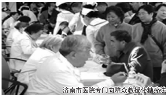
济南市医院专门向群众教授化糖疗法

版的新书《化糖, 糖尿病的革命》中这样写道: “化糖本能是人体自身就具备的, 不是任何人给你的, 任何口服药都给不了你化糖的本能。”