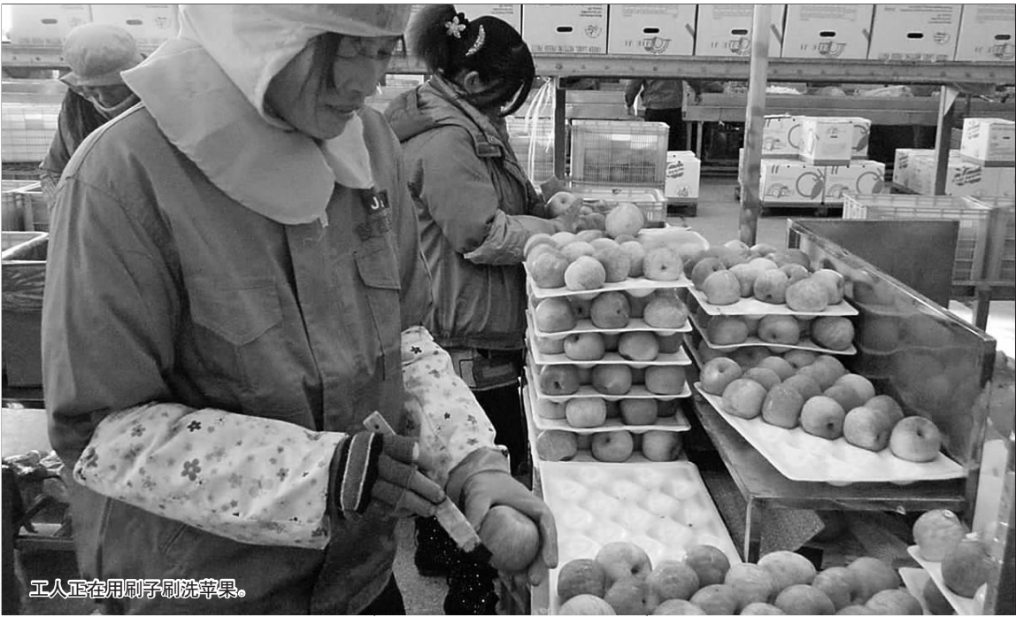
工人正在用刷子刷洗苹果。