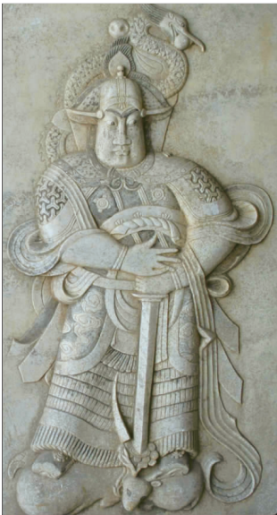
五代时期门神秦琼石刻