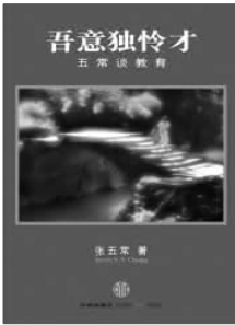
张五常 著 《吾意独怜才》 中信出版社

张五常教授旅居美国,上世纪80年代回中国香港执教,并将自己身处中美不同的教育环境下的求学经历和教育理念差异著书论述。本书从教育理论、求学方法、个人求学经历、教育制度以及对子女的教育方法多角度地阐述了中西方教育制度和思维方法的差异,进行了深刻的对比和分析。