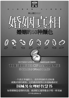
《婚姻真相》 柯云路 著 中国友谊出版公司

有一句老话说得好,幸福都是一样的,而不幸却各种各样。不幸的事情往往受人关注:孩子被父母抛弃、丈夫出轨、小三嚣张……仿佛四处都是铺天盖地的悲剧和不幸。但是那些幸福的事情,那些快乐的事情,却很少