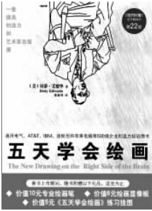
北方文艺出版社 〔美〕贝蒂·艾德华 著 《五天学会绘画》