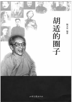
《胡适的圈子》 陶方宣 编著 山东画报出版社

在二十世纪上半叶的京城文化圈,“我的朋友胡适之”曾经是一句令许多文化人引以为豪的口头禅。这句口头禅为一般文化人所津津乐道,其中自