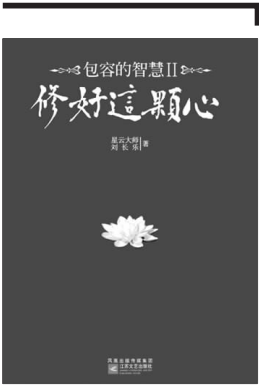
《包容的智慧 II 修好这颗心》 星云大师 刘长乐 著 江苏文艺出版社

《修好这颗心》是星云大师与刘长乐先生继2007年合作《包容的智慧》后的又一次智慧互动,与我们交流人生的阅历、世间的故事、生活的感知、从心治、义利、笃学、慈爱到忍辱、舍得、财富、格局。书中观点和态度更加与时俱进,也更入世、更实用、更贴近读者的生活,而故事也更幽默、更动人。这也就决定了它在风格上的时代感,会让读者进一步体会古老东方哲学与现代都市人呈现出的完美交融。