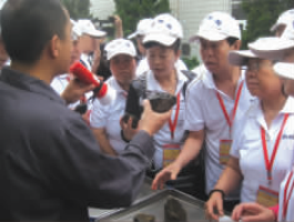
知蜂堂质检部黄部长向参观代表讲解“真胶”和“树胶”的区别

目前,大多数蜂胶厂家没有原料的“前处理”厂,而是从其它的蜂产品企业购买所谓的“提纯蜂胶”,直接做成胶囊。这