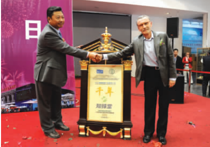
▲联合国国际信息发展组织总干事丹尼尔巴瑞奥为北京知蜂堂颁授“联合国千年金奖”

千年金奖始于 2000 年 发起于联合国 知蜂堂 一个蜂胶生产企业 凭什么进入联合国之“眼” 2010 年 10 月 16 日 知蜂堂荣获联合国“千年金奖”殊荣 这又是何等荣誉