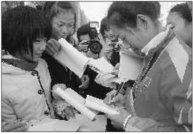
母校(日照体校)的学生将王宁团团围住,争相让亚运会冠军王宁签名。