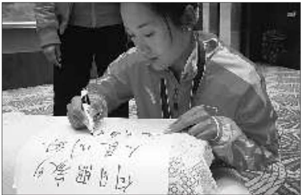
亚运会冠军王宁为本报题字。