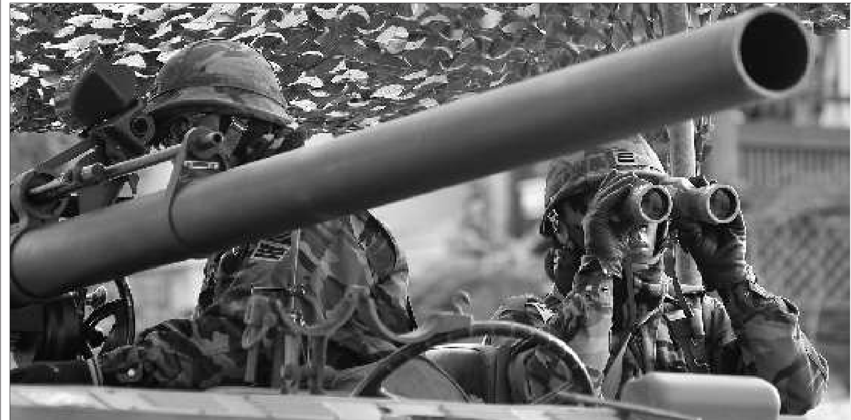
28日,韩国士兵在参加登陆演习前进行训练。