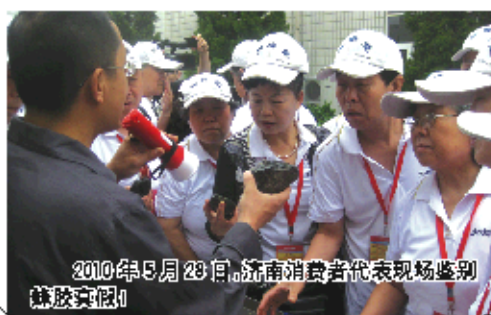
2010年5月23日,济南消费者代表现场鉴别蜂胶真伪!