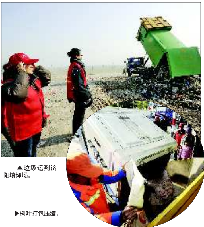
▲垃圾运到济阳填埋场。