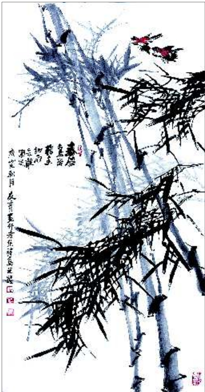
▲春风细雨润物无声 冯凭、冯友青合作

“春风鸟语花香,细雨会声润物。庚寅秋月友青画竹老凭补鸟并题。”刚刚过了102岁生日的青岛画家冯凭先生,与孙子冯友青共同创作了这幅充满生机的国画佳作。