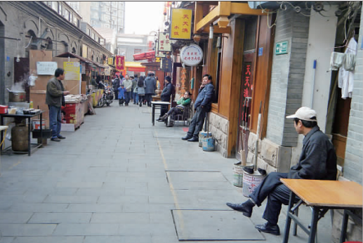
冬天里的劈柴院显得有些冷清。