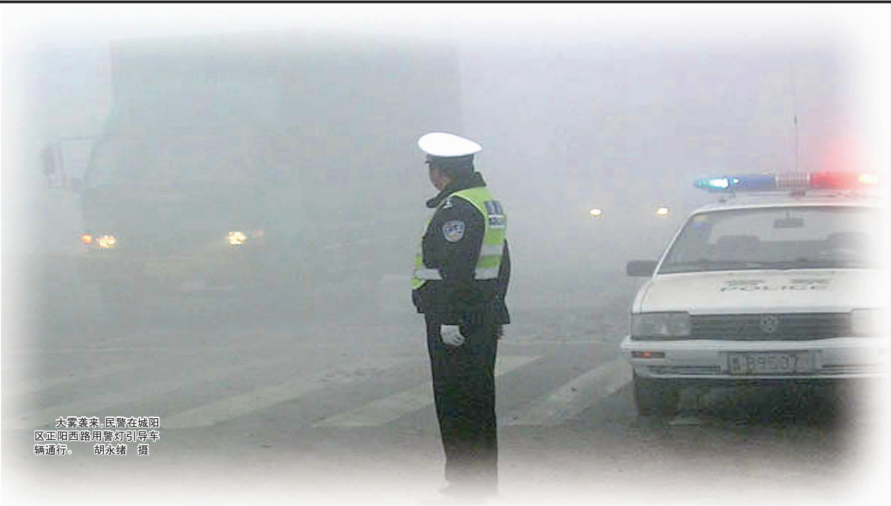
大雾袭来,民警在城阳区正阳西路用警灯引导车辆通行。