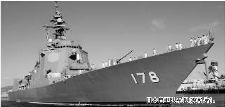
日本自卫队军舰(资料片)。