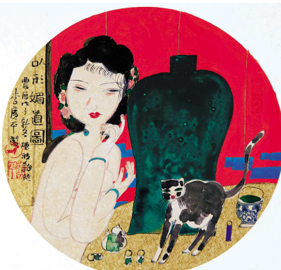
▲《以行媚道图》 工笔人物 李广平 ▲《心观图》之一 工笔人物 李广平 ▲《曾因酒醉鞭名马》 写意人物 李广平