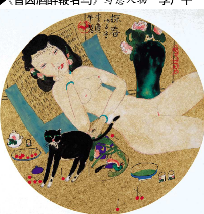
▲《探春》 工笔人物 李广平 ▲《心观图》之二 写意人物 李广平 ▲《品箫》八条屏 写意人物 李广平