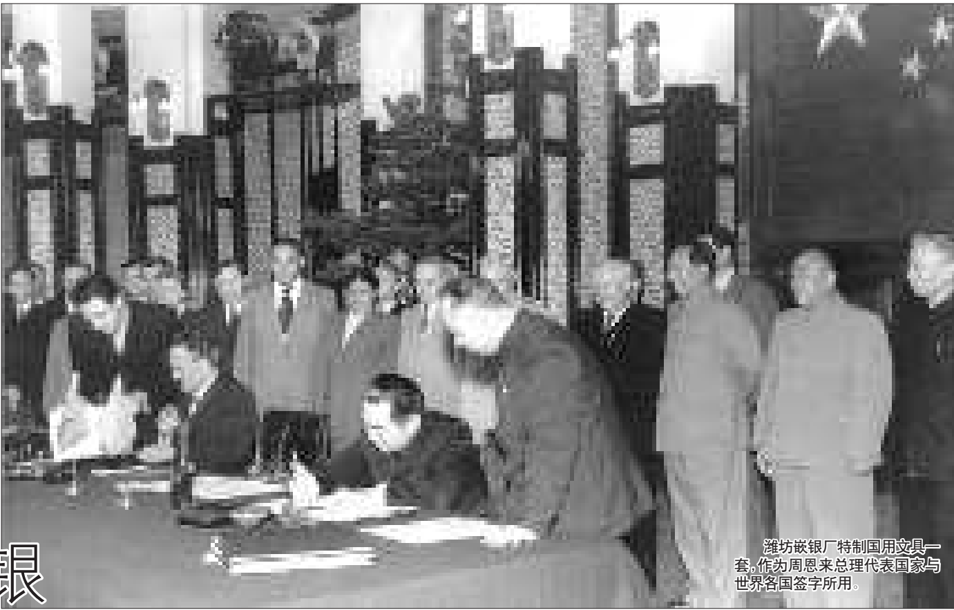
潍坊嵌银厂特制国用文具一套,作为周恩来总理代表国家与世界各国签字所用。

嵌银是潍坊独具特色的民间艺术之一,如今高贵典雅的嵌银艺术品已经进入寻常百姓家,然而,数十年前,嵌银艺术品作为珍贵之物被当作敬献领袖、赠送外国友人的礼物,不仅稀有而且神圣,也是在那个时期,潍坊嵌银的工艺精髓达到了登峰造极的程度,给它带来了不可复制的辉煌。