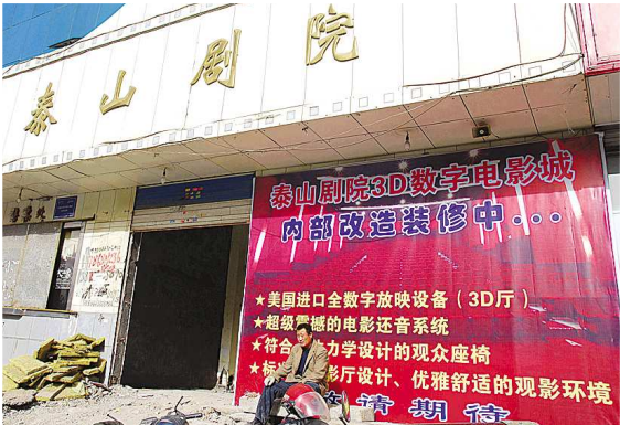
改造装修中的泰山剧院。