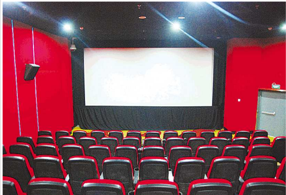
鲁信影城。

业内人士指出,商业综合体内部的影院,可以让消费者的滞留时间增加至少一倍以上,而餐饮、休闲、购物等消费方式也为影院提供了更多潜在客源。