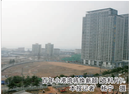
百年小港湾将换新颜(资料片)。

2006年和记黄埔拿下小港湾改造项目时曾轰动一时,但是却迟迟不见动静,2008年金融危机时,甚至一度有传闻说该项目要撤资。 6日,记者从青岛市规划局获悉,青岛西部老城区小港湾改造规划调整方案出炉。在小港湾区域1.5公里的海岸线上将打造97万平方米的大型社区,形成集旅游、娱乐、商业、休闲为一体的新型城市综合体。 小港湾改造面纱正式揭开,而这距离小港湾改造项目被和记黄埔拿下已有4年时间。2006年和记黄埔拿下小港湾改造项目时曾轰动一时,但是却迟迟不见动静,2008年金融危机时,甚