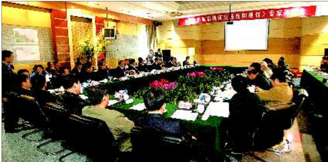
专家评审会现场。