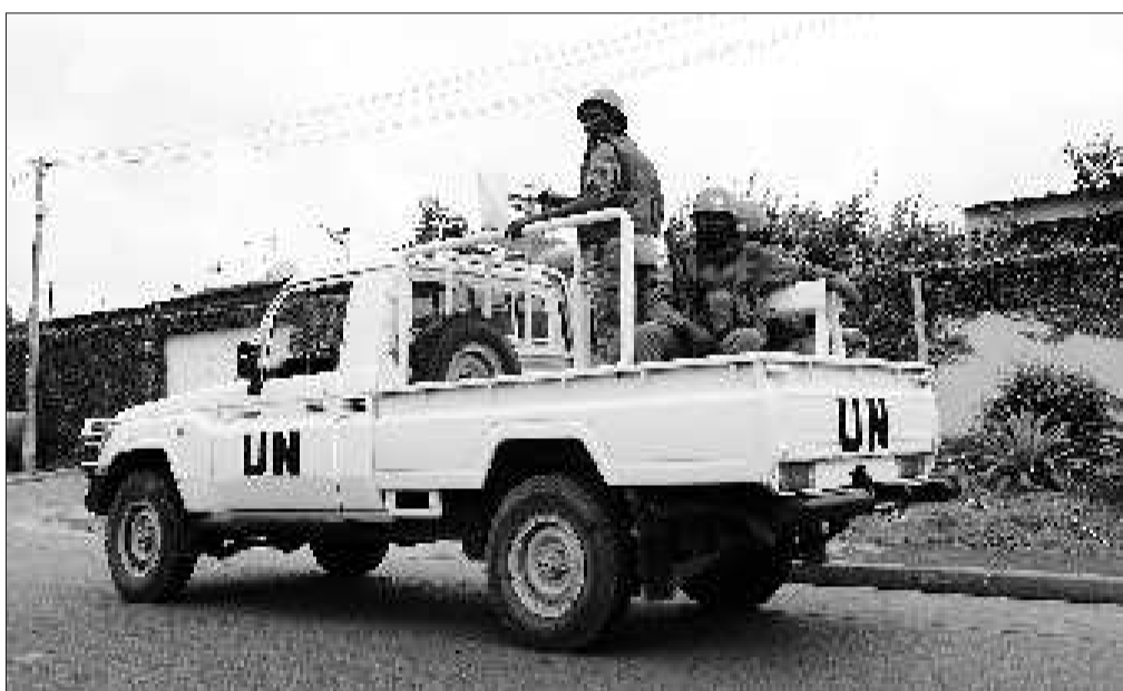
17日，联合国维和部队在科特迪瓦阿比让街头执勤。

联科部队本次授权定于20日到期。奥布莱说，科特迪瓦政府认为联科部队实施了一些“与所获授权不一致的行为”，因此反对授权联科部队继续驻扎科特迪瓦。