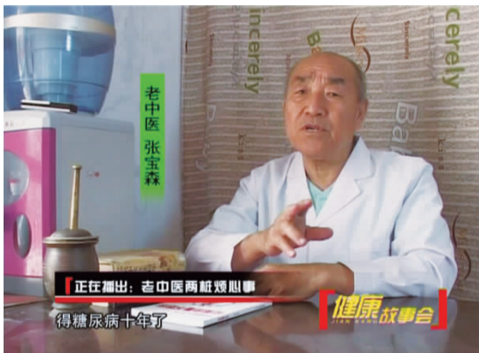
制住血糖指标, 病也会越来越严重 血糖高了, 病还是越来越重, 到底该怎么办?