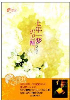
◆书名:七年一梦迟迟醒 ◆作者:芬妮欣欣 ◆出版社:朝华出版社

电视上一个西装男人正在侃侃而谈,口水飞溅,针对大盘形势进行短期预测,电视台善于抓住人们妄想一夜暴富的投机心理,所以所谓“专家教你玩投资”栏目永远这么吃香。可是钱这个东西比男人的心女人的泪还要捉摸不透,如果一夜致富真的那么容易,纪清浅当年也不至于会沦落到无路可走的地步。