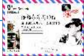
◆书名:给福尔摩斯的信 ◆作者:儒爵爷 ◆出版社:古吴轩出版社

张瑞恒胆怯地看了一眼我和瑞恩,就抓紧了齐千禧的胳膊,然后使劲地摇了摇头。这时,瑞恩变戏法似的从兜里掏出一根棒棒糖,一手递过去一手张开怀抱,说:“小朋友,来叔叔这里,叔叔有糖吃。”边说边扮鬼脸。