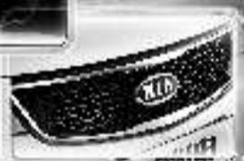
正时、进气、排气大泵加持