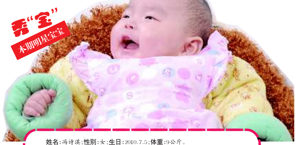
秀“宝” 本期明星宝宝

本报12月29日讯 (记者 张纪珍)29日开始影响临沂的强冷空气,将使2010年的最后几天,在持续的低温寒冷中度过。记者从气象部门获悉,2011年元旦期间,临沂最低温-9℃左右。 受强冷空气影响,29日白天临沂的天气就已经变冷了不少。而29日夜间,随着偏北风风力的逐渐加大,气温是直线下降。据气象部门预计,30日早晨出门的市民就会感觉出天气明显变冷了。 2010年的最后几天,临沂将持续低温天气,最低气温-9℃,最高气温也在0℃左右徘徊。而强冷空气带来的寒冷,还将跨越到2011年的第一天,从气象部门29日的预报来看,2011年1月1日这天,虽然天气晴朗,但仍然刮着北风,最低气温也只有-9℃。 马上就到元旦小长假了,从目前的预报来看,元旦三天小长假,临沂将“沉迷”在低温中,2011年1月2日、3日,最低气温虽有升高,但是由于这两天以多云或阴天为主,虽然气温升高,但由于没有阳光的照射,市民一样会感觉天气寒冷。 具体天气预报为:30日多云到晴,偏北风4~5级阵风6级,气温-7~-1℃。 31日晴到少云,偏北风4~5级,气温-9~0℃;2011年1月1日白天晴到少云,偏北风3级,气温-9~2℃。