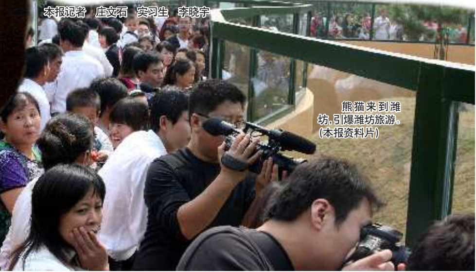
熊猫来到潍坊,引爆潍坊旅游。(本报资料片)