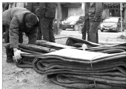
▲河岸上备好了充气袋,为打捞做准备。 ▲打捞人员砸开运河上厚厚的冰,以便打捞沉船。

岸边上。现场施工工人说,他们将把气袋从沉船底下绕过去,借助气袋的力量,把沉船顶出水面,然后抽干两艘船里的水。 下午4点半左右,沉船周围的冰全部敲碎。随后,两名打捞人员乘一艘小船,用锤子、镐等工具,在沉船外周长约30米、宽约10米的冰面上,敲开一条宽约1米的通道,以便放置气袋。 下午5点,打捞前期准备工作基本完成,并在岸边临时搭建起一个小棚,各种打捞工具放在里面。工作人员表示,31日8点左右,沉船打捞工作将正式开始。